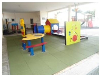
Exterior (Pré CATL)

Os espaços destinados às respostas sociais de apoio à infância estão organizados em: