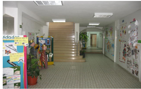
Entrada Principal – Exterior e Interior